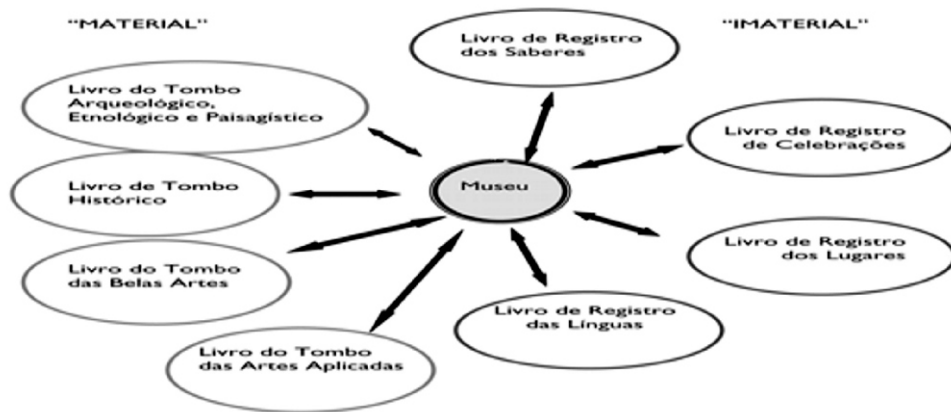
Figura 1: Relação Museu & Patrimônio