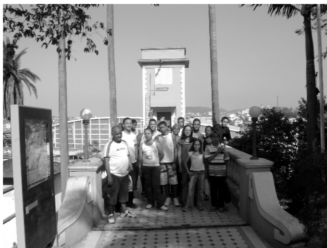
Figura.2- Grupo chegando ao prédio do MAST

retorno, os visitantes respondiam ao questionário. Após a permanência no museu, de duas ou três horas, o ônibus retornava à comunidade. As figuras 2 e 3 apresenta respectivamente, uma imagem do grupo chegando ao prédio do MAST, e uma imagem da visita ao pavilhão da Luneta Equatorial no campus do MAST.