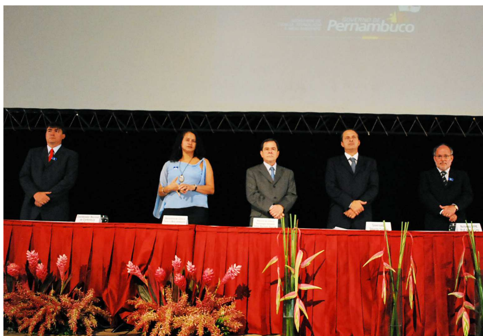
Cerimônia de abertura da Conferência Estadual de Ciência, Tecnologia e Inovação

De acordo com a programação, a abertura ocorreu no Centro de Convenções da UFPE e a mesa de abertura foi composta das seguintes autoridades: Governador do Estado, Ministro de C&T, Secretária de C&T e Meio Ambiente, Reitor da UFPE, Secretário executivo de Tecnologia, Inovação e Ensino Superior, o Secretário de Desenvolvimento Econômico do Município de Recife e a